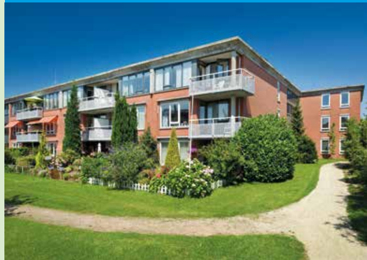
De Flank Diaconessenlaan

Zorgeloos zelfstandig wonen met alle voorzieningen dichtbij