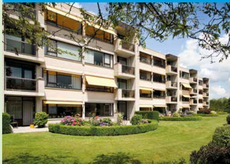
De Schans Koningin Wilhelminalaan

Zorgeloos zelfstandig wonen met alle voorzieningen dichtbij