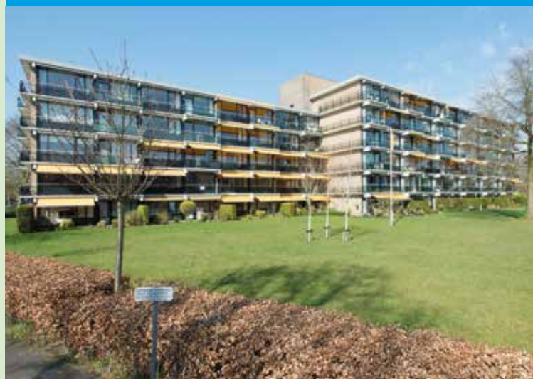
Het Ravelijn Graaf Lodewijklaan

Zorgeloos zelfstandig wonen met alle voorzieningen dichtbij